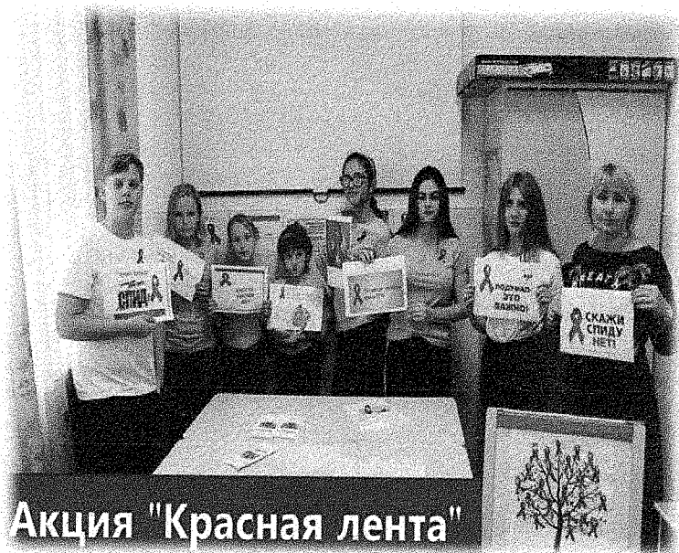
Акция "Красная лента"